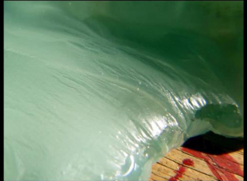
Verre et rouge