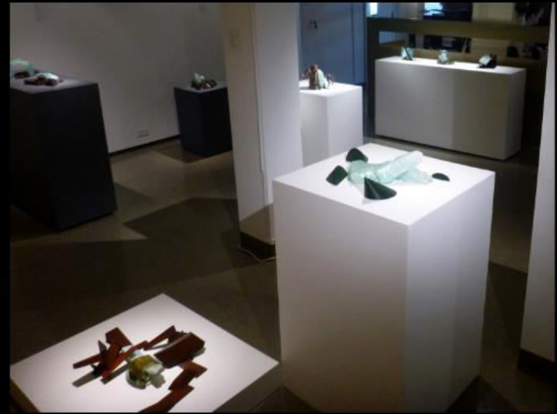
Galerie Espace VERE - 15 janvier au 2 février 2018