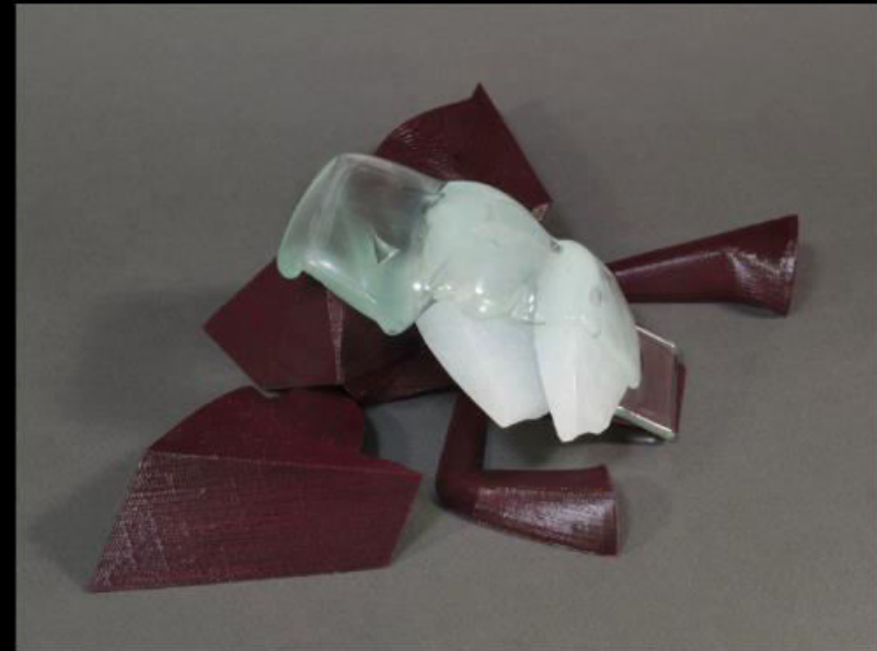
8 x 28 x 20 cm

L'horizon s'éloigne tranquillement Ce qui se cachait derrière Prend place Plus rien n'est à sa place