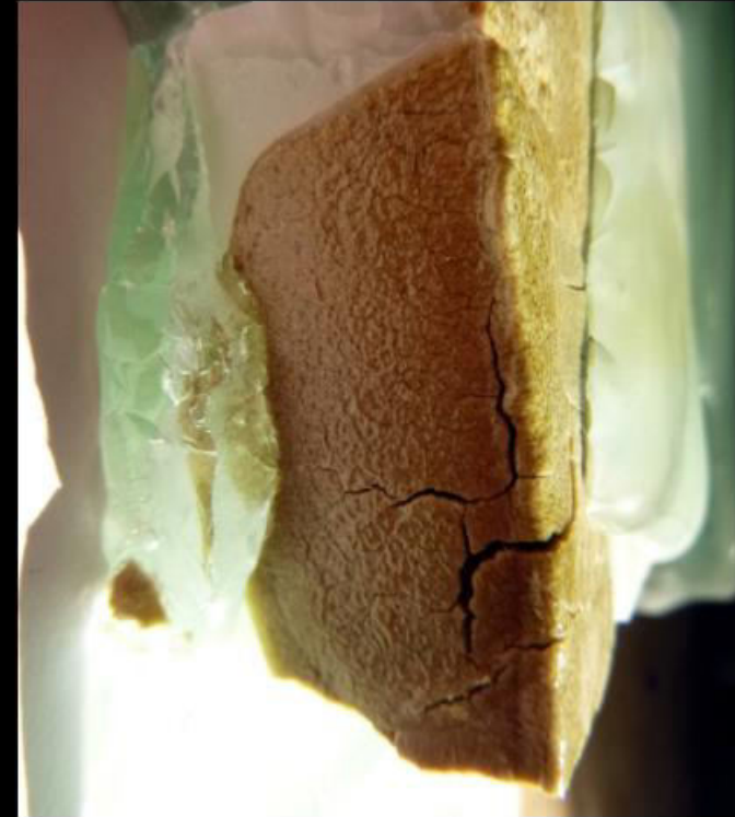
Ça ne te regarde pas